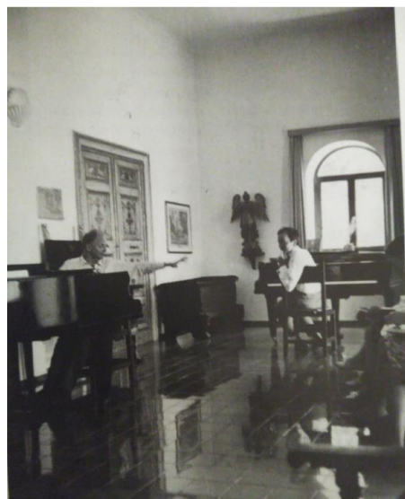
Der legendäre Pianist Wilhelm Kempff beim Unterricht in Positano, im selben Raum, in dem der Unterricht heute noch stattfindet.

1957 veranstaltete Wilhelm Kempff in Positano/Süditalien seinen ersten Beethovenkurs in der von ihm nach seinen eigenen Plänen errichteten "Casa Orfeo". Es war ihm ein Anliegen, seine reichen Erfahrungen an die jüngere Generation weiterzugeben. Die Einweihung des ersten Kurses fand unter Mitwirkung seines Freundes und Kollegen Alfred Cortot statt. Seit 2013 wird die klassische Schiene der Beethovenkurse um ein Meisterkursprogramm zur zeitgenössischen Musik erweitert. In Reflexion zu Beethoven setzt sich das neue Klavierforum Positano „Beethoven und die Moderne“ vornehmlich mit Werken der zeitgenössischen Musik auseinander. Dabei soll bei den teilnehmenden Studenten – neben einem neuen Blick auf und neuen Interpretationswegen zu Beethovens Oeuvre – auch das Bewusstsein für die Verbindungslinien zwischen dem Werk des großen Klassikers und modernen Klavierkompositionen geschärft werden' (Beschreibung aus der Website der Akademie).